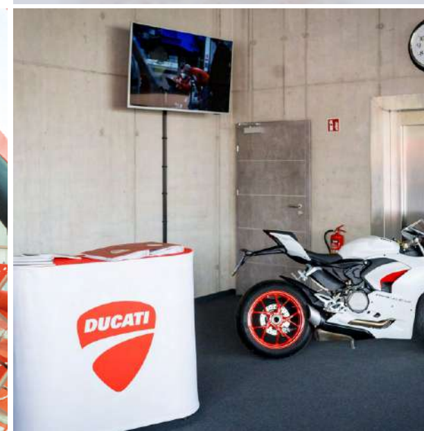
Lada (trybunka) 1,00 x 1,20 x 0,45 m [wys. x szer. x gł.]