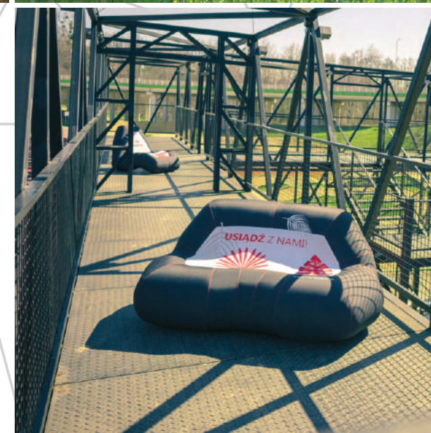
Sofa VENTO® 0,80 x 1,70 x 1,10 m [wys. x szer. x wys.]