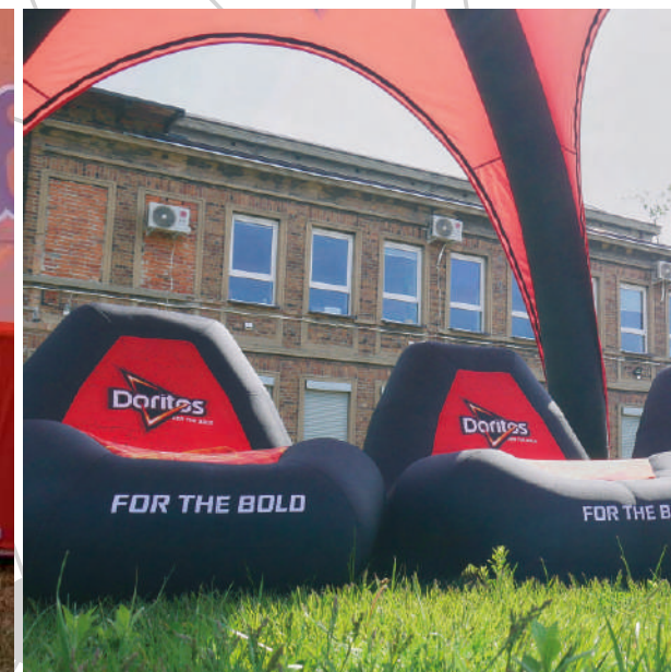
Fotel VENTO® 0,85 x 1,04 x 1,20 m [wys. x szer. x wys.]

Fotel i sofa linii VENTO® to doskonale uzupełniające się produkty, zapewniająca Twojej marce nie tylko powierzchnię i formę reklamy najwyższej klasy. To dmuchane dzieła sztuki, pozwalające przeżyć uczestnikom eventu chwilę relaksu, której nie opiszą znane ludzkości słowa. Bezproblemowe w transporcie, nie wymagają użycia wentylatora. Dzięki fotelom i sofom linii VENTO® ugościsz swoich odbiorców po królewsku.